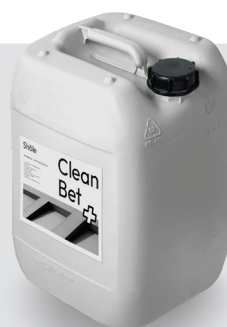
Kanister 20 l