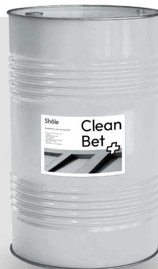
Beczka 210 l