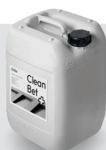
Kanister 5 l